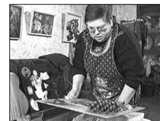
№ 160. «Дураковина». И. Беляев. (Кадры слева)