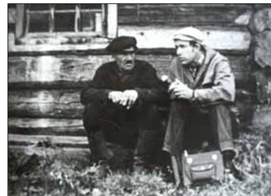
№ 164. Кадр из очерка «Горскино»

Сюжет был показан в эфире. Настал понедельник. Летучка.