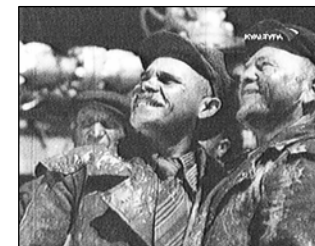
№ 165. «Нанук с Севера» Р.Флаэрти. (Кадры слева) № 166. «Человек с киноаппаратом». Д. Вертов (Кадры справа)